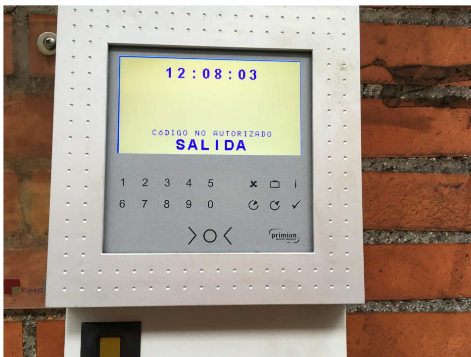
Ejemplo: Fichaje de salida incorrecto (Código de tarjeta no autorizado)