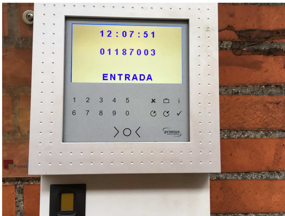
Ejemplo: Fichaje de entrada correcto (Código de tarjeta 01187003)